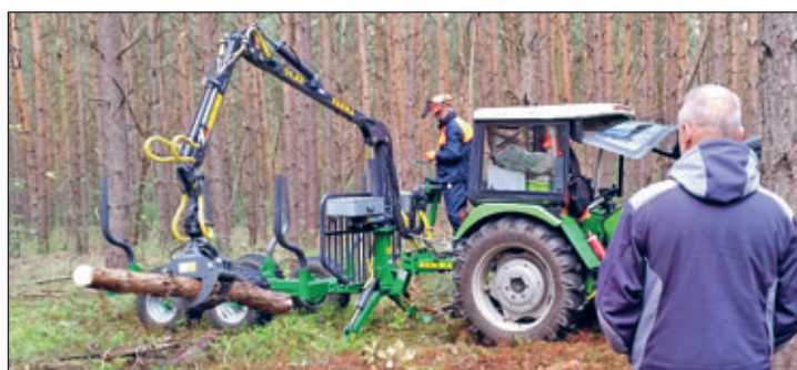
Holzrückung mit Traktor und Rückeanhänger im Privatwald

Anmeldung bis 06.09.2024 an info@fbg-grossenhain.de oder 0175/9379495