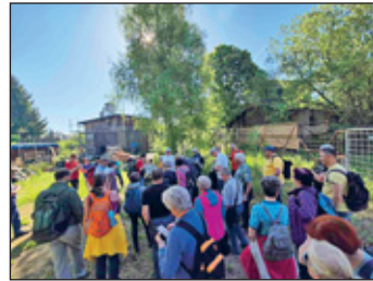
Wanderer machen Halt beim Lokschuppen in Lommatzsch

Bei schönstem Frühlingwetter haben die Vereinsmitglieder am 26. April die Saison 2025 mit einem Arbeitseinsatz begonnen. Bei diesem wurde das Gelände rund um das Bahnhofsgebäude gepflegt. Weiterhin wurden Verschönerungsarbeiten vorgenommen und Winterschäden beseitigt. Dadurch konnten wir unseren Besuchern und Wanderfreunden am 1. Mai 2025 ein gepflegtes Museumsobjekt anbieten.