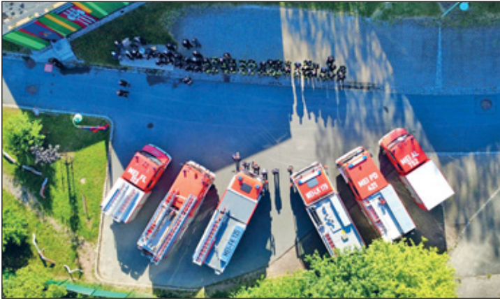
Übergabe Feuerwehrfahrzeug Kagen