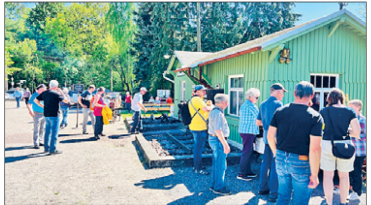
Andrang bei der Verpflegungsstelle in Löthain

Zu unserer traditionellen Bahndammwanderung von Lommatzsch nach Löthain am 1. Mai 2025 durften wir über 60 Wanderfreunde begrüßen. Neben diesen Wanderfreunden konnten wir auch zahlreiche interessierte Besucher und Fahrradfahrer im Bahnhofsgebäude willkommen heißen.