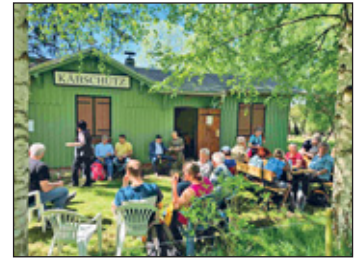
Rast bei der Järgergemeinschaft Käbschütztal