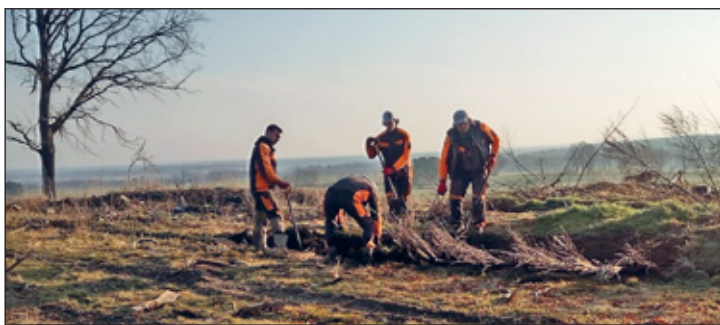
Wiederaufforstung von Wald durch Fachkräfte

Anmeldung bis 31.08.2025 an info@fbg-grossenhain.de oder 0175/9379495