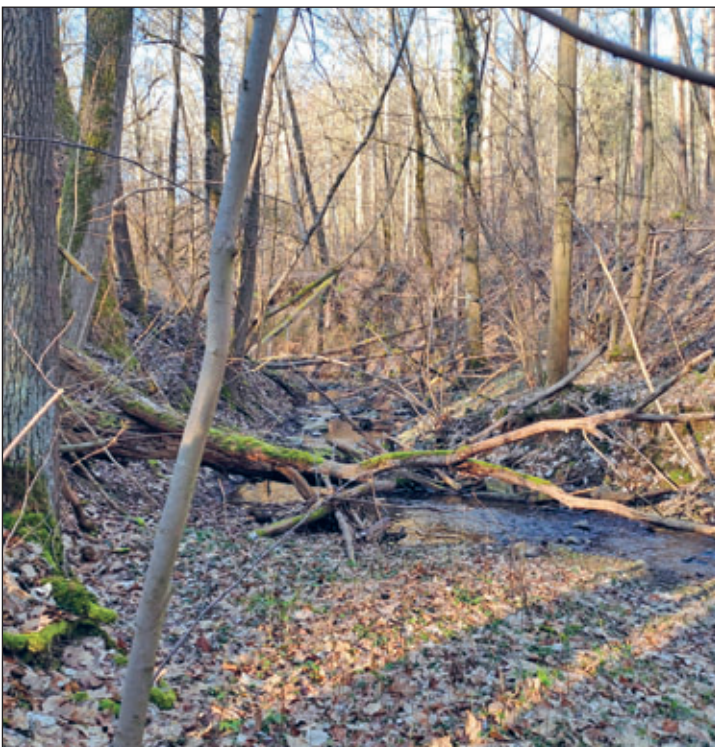
Flussholz ist ein wertvoller Lebensraum und darf in der freien Landschaft im Gewässer bleiben.

Dieser Text entstand in Zusammenarbeit der Fachberaterinnen und Fachberater Gewässer des Landesamtes für Umwelt, Landwirtschaft und Geologie und der unteren Wasserbehörde des Landkreises.