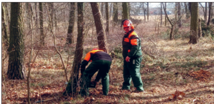
Baumfällung unter fachlicher Anleitung beim Motorsägenlehrgang A