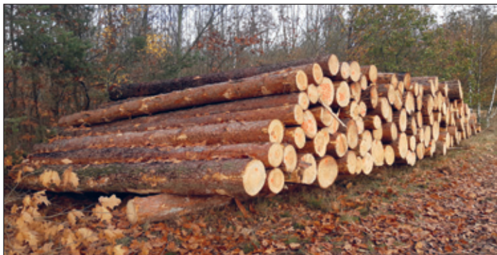
Wird Holz rechtzeitig in Wert gesetzt, sind die Kosten für die Aufforstung finanzierbar

Eine große Verantwortung bezüglich einer Entscheidung für oder gegen Windräder im Wald trägt jeder Landeigentümer selbst.