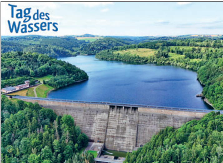
Bildurheber: Landestalsperrenverwaltung Sachsen/Jan Gilak

Autor: Landestalsperrenverwaltung Sachsen